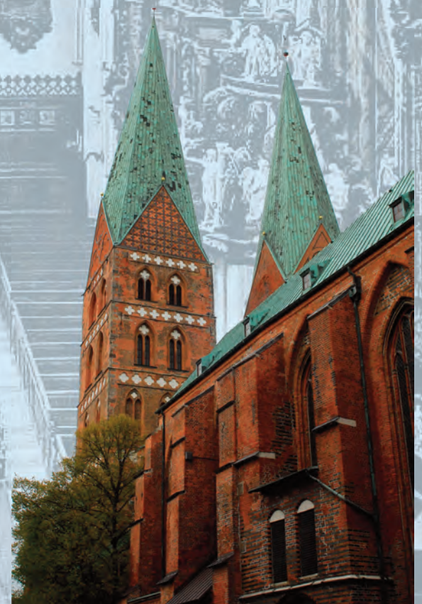
St. Marien zu Lübeck